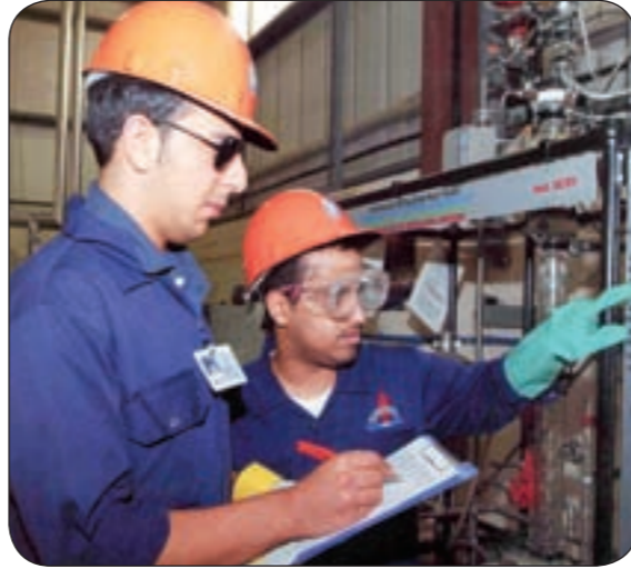
نسبة العمالة الوطنية في المصانع لا تتجاوز الـ 2%

عند تطبيق قرار نسب العمالة الوطنية للمصانع التي شملتها الدراسة مثل «سائق، عامل نقل، مندوب، موزع» وهي وظائف بطبيعتها غير جاذبة للمواطنين الباحثين عن الوظائف. كما اعتبرت الشركات من خلال ردودها أن النسبة الحالية 2% مناسبة ولا تحتاج لتعديل ويمكن إعادة النظر فيها بعد فترة. وحسب ما ورد في الدراسة يغلب على العمالة الوطنية عموماً عدم الالتزام بمواعيد العمل وكثرة الإجازات الطبية والبطالة وكذلك عدم توافر الخبرات والمؤهلات المتخصصة للمصانع وعزوفهم عن العمل داخل المصانع أو في أماكن بعيدة عن المناطق السكنية. فيما يتعلق بمقترح تعديل النسبة من ثابتة إلى نسبة متغيرة حسب المهنة، اقترحت الشركات حسب ما جاء في الدراسة تطبيق النسبة على إجمالي الوظائف وليس على مهن محددة لصعوبة تعيين الكويتيين في بعض الوظائف وخاصة الفنية داخل المصانع إضافة إلى إمكانية ترك توزيع النسبة الحالية لكل شركة حسب حاجتها من الوظائف وحسب قبول الكويتيين لها.